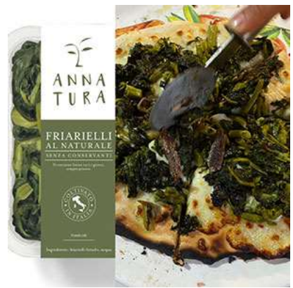
Un'idea di utilizzo dei friarelli al naturale