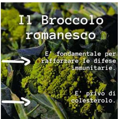
Focus sul broccolo romanesco

La comunicazione sui social serve all'azienda per evidenziare la forza e il valore del prodotto di alta qualità , a partire dall'origine italiana delle materie prime e il controllo su tutta la filiera. Pur essendo pronti, i prodotti di Annatura mantengono inalterate le loro caratteristiche naturali e questo è il messaggio più importante da trasmettere ai consumatori.